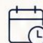
Allongement du traitement